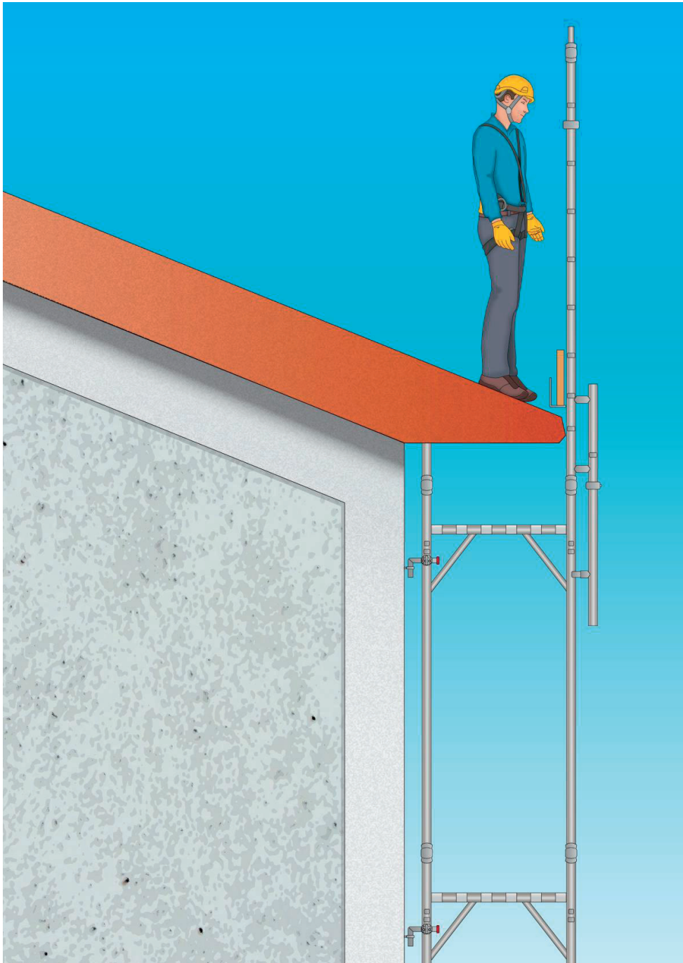
Figura 5 - Esempio di ponteggio utilizzato per la protezione dei bordi