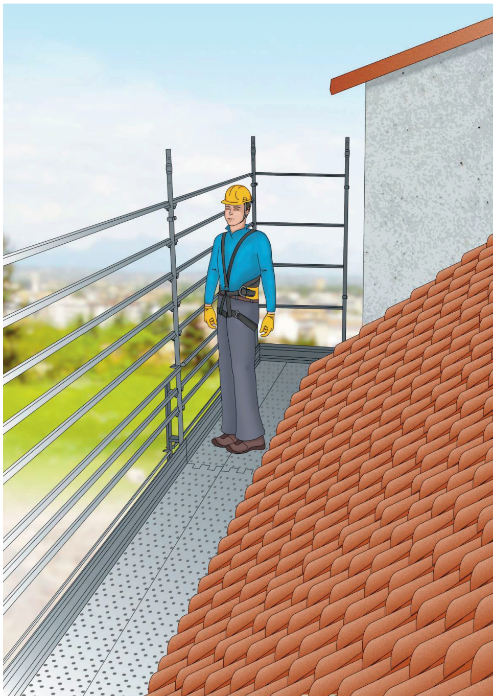
Figura 4 - Esempio di ponteggio utilizzato per la protezione dei bordi